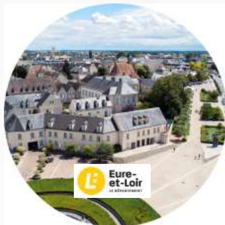
▲ Le Conseil départemental d'Eure-et-Loir