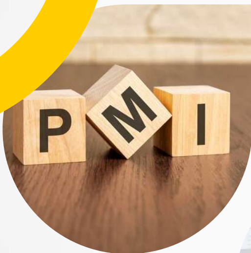
▲ La Protection Maternelle et Infantile